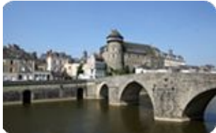
Ville d'Art et d'Histoire