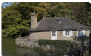
Les célèbres Toiles de Mayenne

Mayenne-tourisme.Villes-et-villages-de-caractere