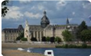
Cité millénaire, Plus beau détour de France

Mayenne - Ancienne cité ducale Fontaine Daniel - Les célèbres Toiles de Mayenne