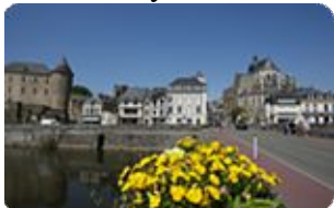
Ancienne cité ducale